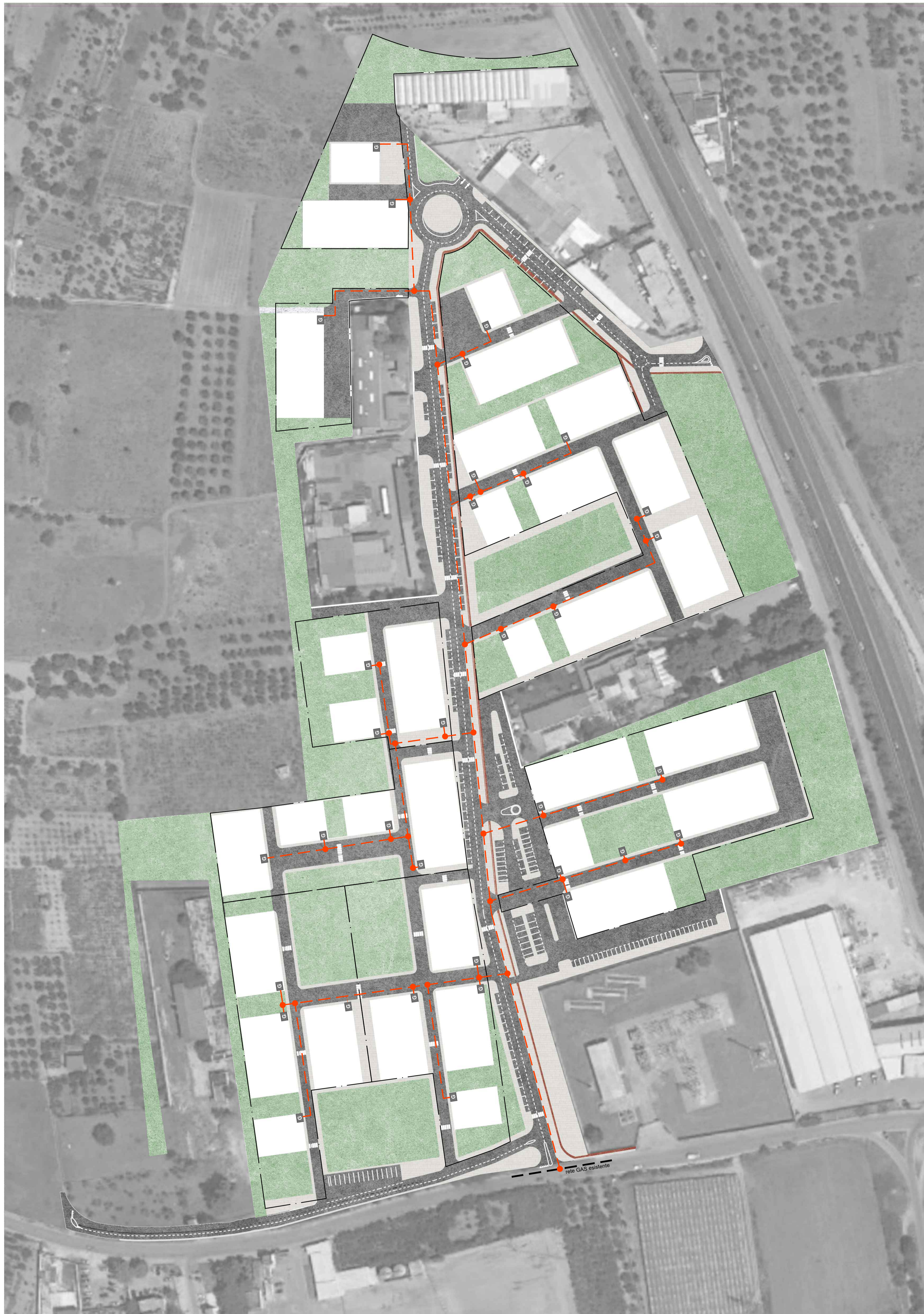
PLANIMETRIA GENERALE - rapporto 1:1.000