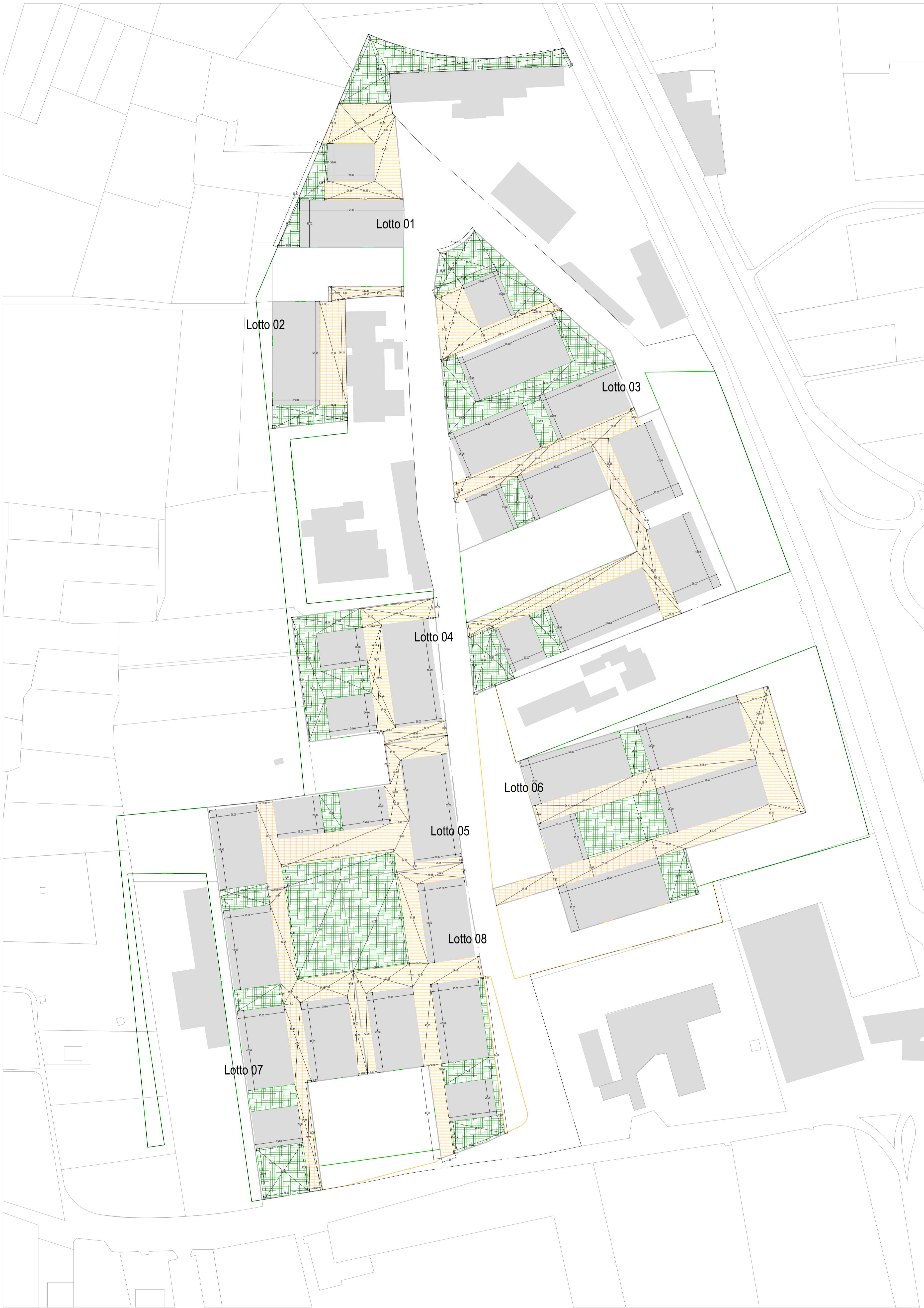
VERIFICA STANDARD DEI SINGOLI LOTTI - rapporto 1:1.000